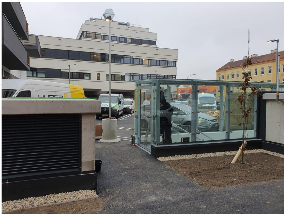
Ausgang mit Lift zur Stadlauer Straße