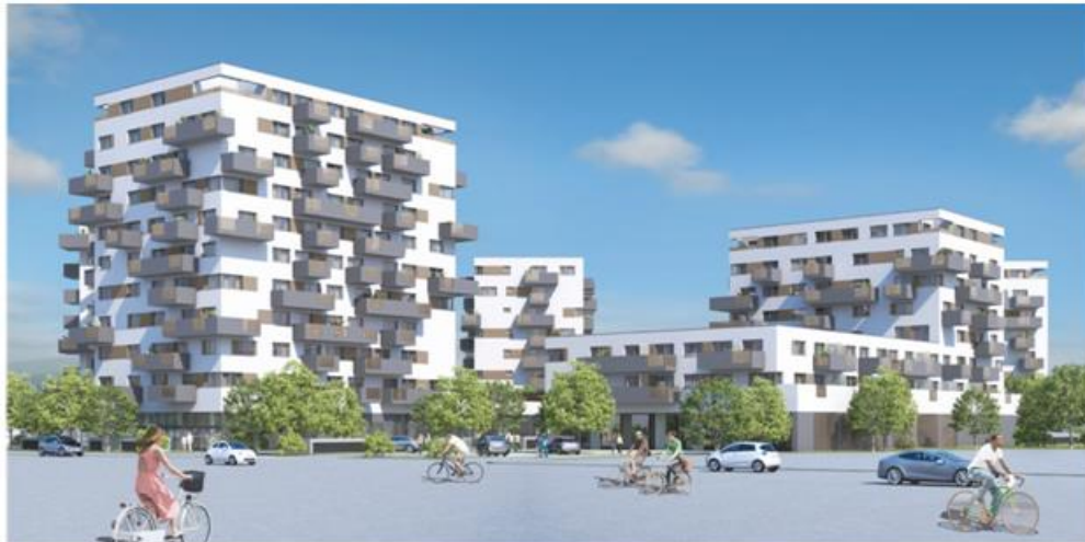
Wohnkomplex Stadlauer Straße 64, 1220 Wien