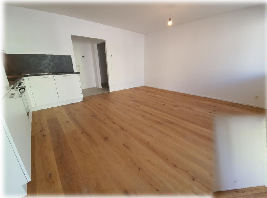
helles, hofseitiges Wohnzimmer mit hochwertiger Komplettküche