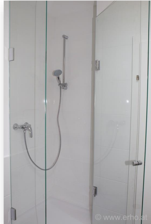
Badezimmer mit Dusche und WC