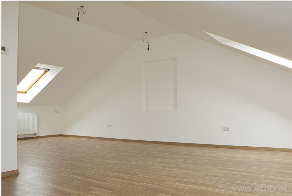
großes, helles Wohnschlafzimmer (L-förmig – leicht teilbar)