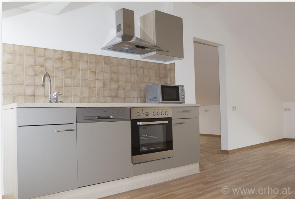
neue Einbauküche mit Geräten (Kühl-Gefrierkombination, Geschirrspüler, Backrohr, Cerankochfeld, Mikrowelle)