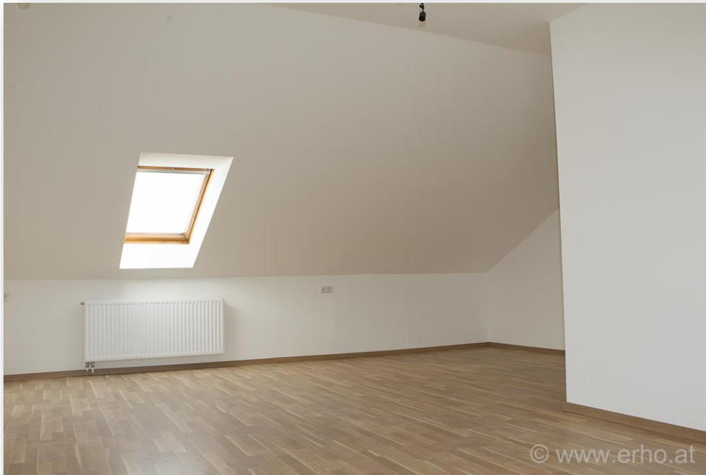
großes, helles Wohnschlafzimmer (L-förmig – leicht teilbar)