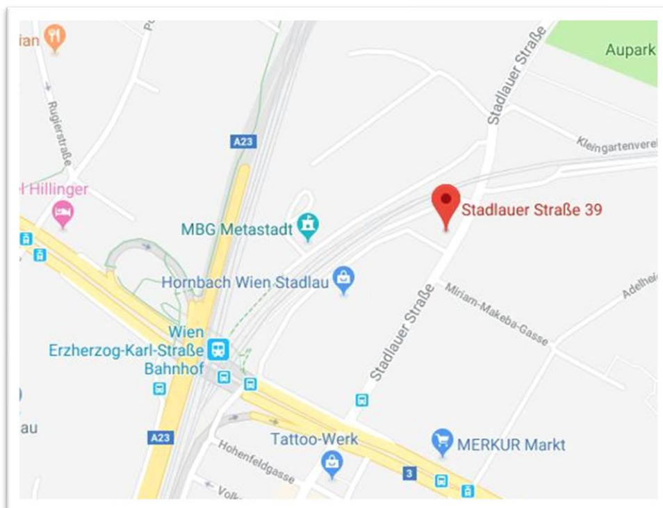
Lageplan 1220 Wien (Stadlau) – Stadlauer Straße 39