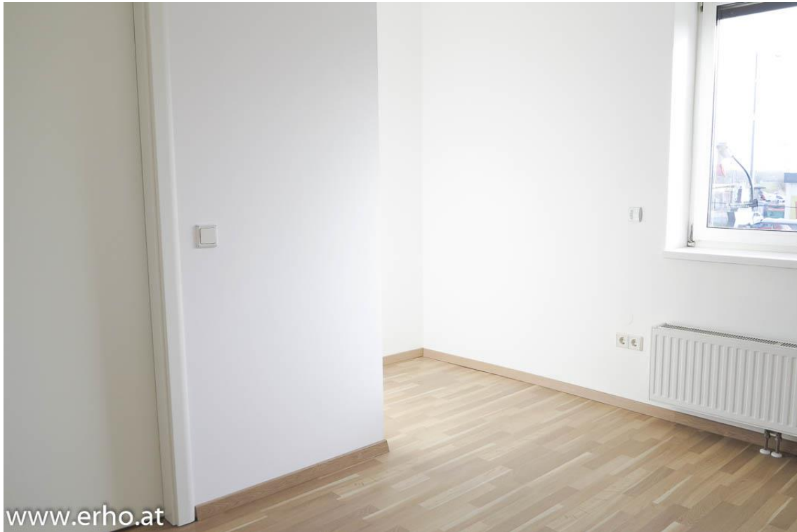
Schlaf- / Kinderzimmer 2