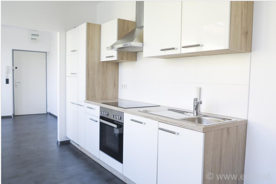
Gartenseitige Einbauküche mit Wintergartencharakter Abstellraum neben der Küche vorhanden