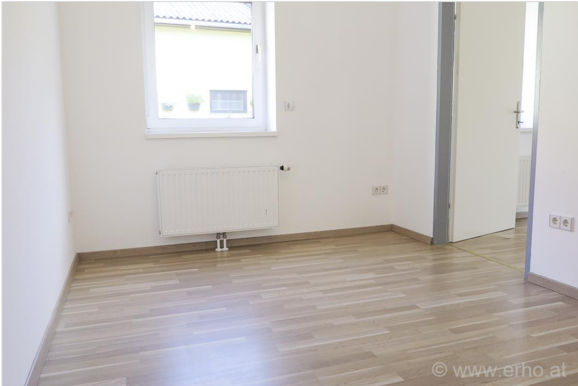
Schlaf- / Kinderzimmer 1