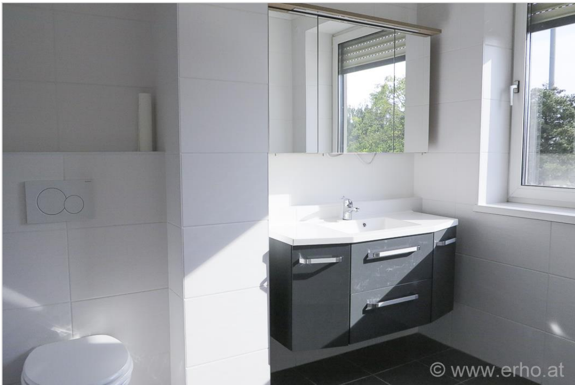
Großes Badezimmer mit Badewanne