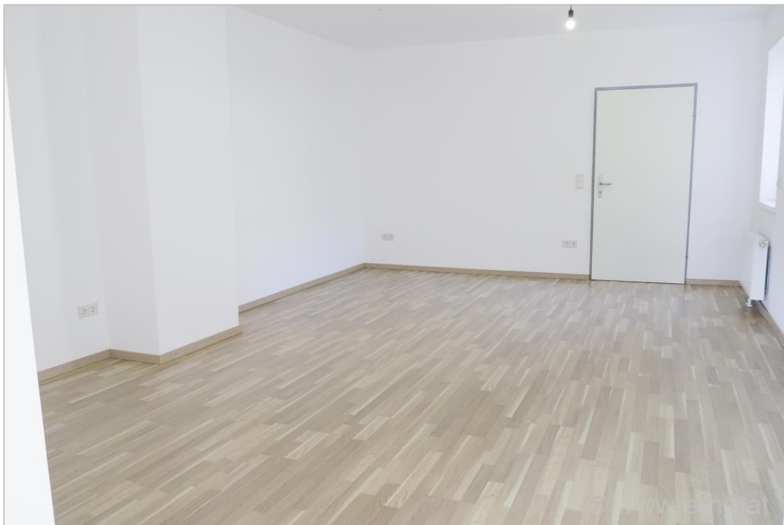
Großes Wohnzimmer (hofseitig)