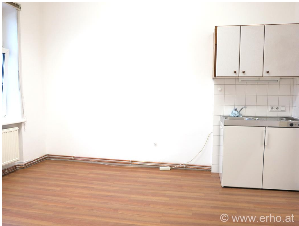
Bürraum 03 (mit Kaffeeküche)